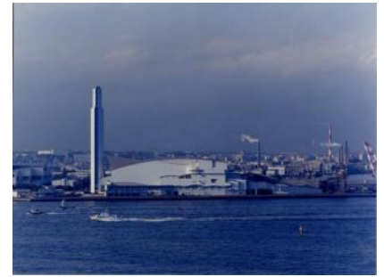
横浜市資源循環局鶴見工場

鶴見工場のごみ処理量は約25万トンで、横浜市全体の約3割を鶴見工場で焼却しています。ごみを燃やすことによって作られた電気は工場内で使用する他、ふれーゆ（プール等）や水再生センターにも送られています。東京ガス横浜テクノステーションには、排ガスから分離回収するCO 2 （主にバイオマス由来）を原料として提供しています。