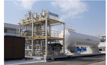
東京ガス横浜テクノステーション メタネーション施設

メタネーションの実証試験施設です。太陽光由来の電気による水電解装置・メタネーション装置の課題の把握と共にカーボンニュートラルエネルギーの製造から利用に関連するまでの一連の技術・ノウハウの獲得を目指しています。